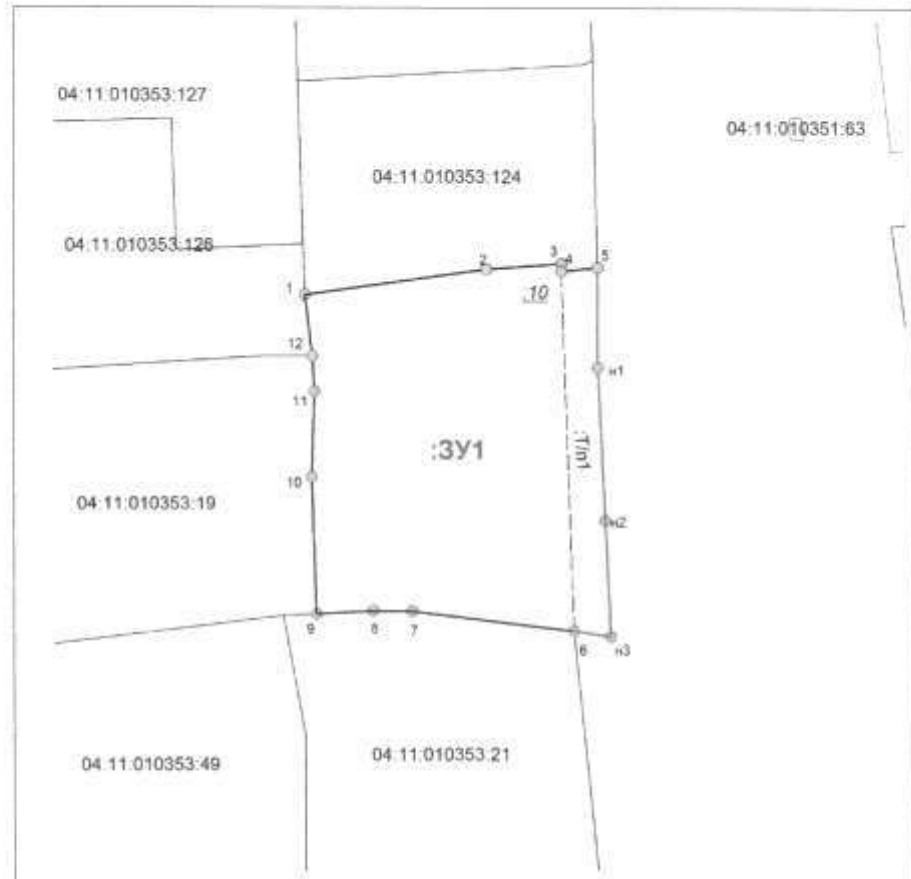
Схема расположения земельного участка