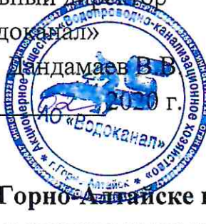
График отключения холодного водоснабжения в г. Горно-Алтайске на 2020 год для подготовки объектов водоснабжения к отопительному периоду 2020-2021 г.